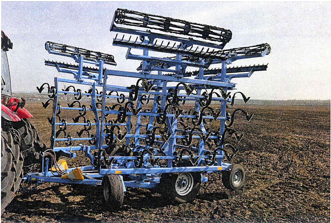
Рисунок 1 – Культиватор полуприцепной КБМ-8-4П-Г1К-ВС (вид спереди слева).

Культиватор запускается в работу после вспашки и последующего дискования и агрегируется с тракторами класса 3-4.